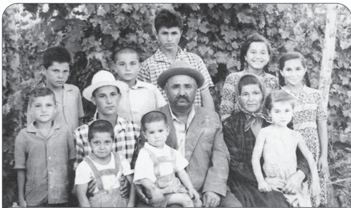
Наша семья: мама, отец и 10 детей

только внуки, но теперь уже правнуки и даже праправнуки последовали за Христом. Жалко, что бабушка не знала всей силы завета, который Бог заключил с народом Своим, тогда она не оплакивала бы нас так безнадежно.