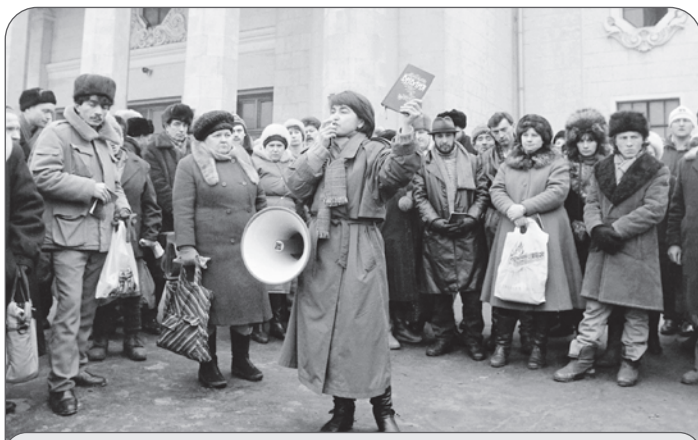
Проповедь Слова Божьего у Ленинградского вокзала в Москве

Необходимо покаяние, «метанойя» — преображение. Человек меняется благодаря Слову Божьему, которое нужно душе так же, как пища для тела. Но беда в том, что у большинства людей времени для Книги жизни никогда не находится. И пылится она на полке годами, круглая сирота. Говорят, когда американцы собирались полететь на Луну, думали, какой бы подарок от землян отвезти, и ничего лучше Библии не нашлось. И правда, не айфон же Луне дарить?